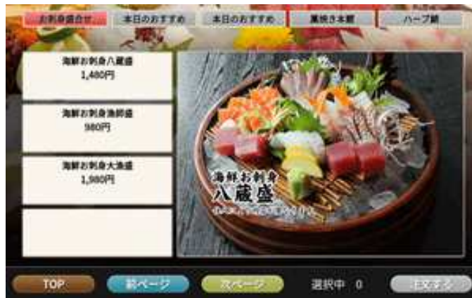
4個表示(右画像有り)