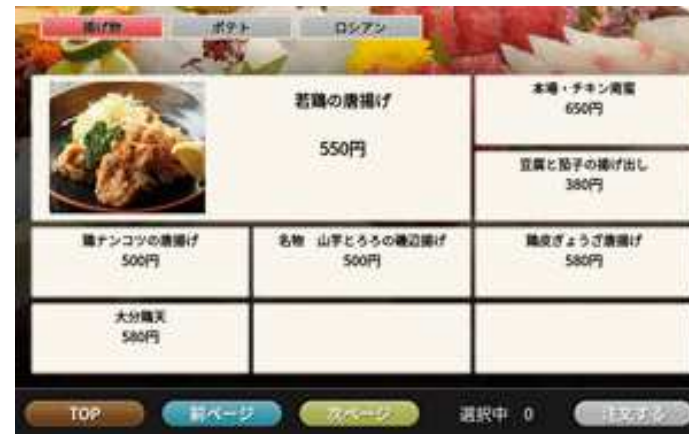
9個表示(画像有り1+画像無し8)