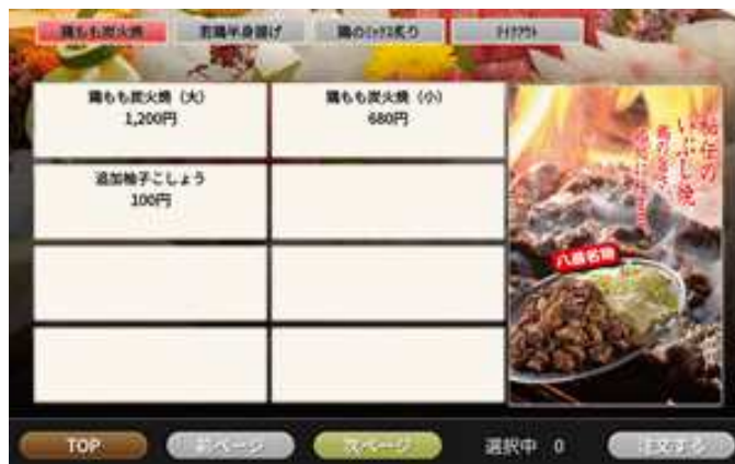
6個表示(右画像有り)