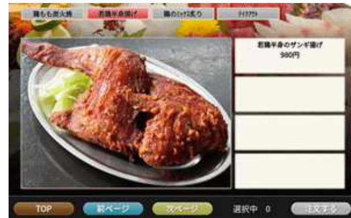
4個表示(左画像有り)