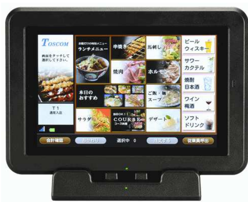
■クレードルでの運用