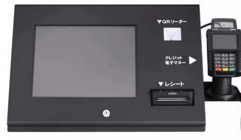
【キャッシュレス決済ユニット】(メインユニット)