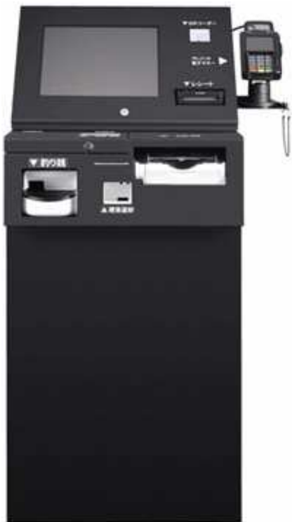
【一体型自動釣銭機】