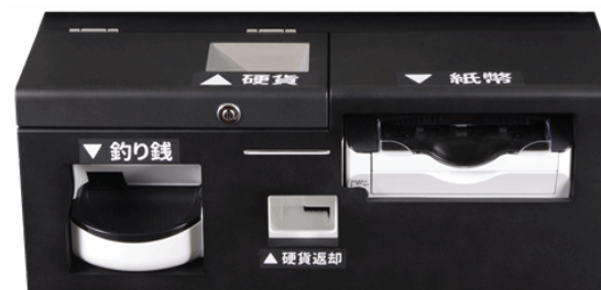
【硬貨・紙幣決済ユニット】